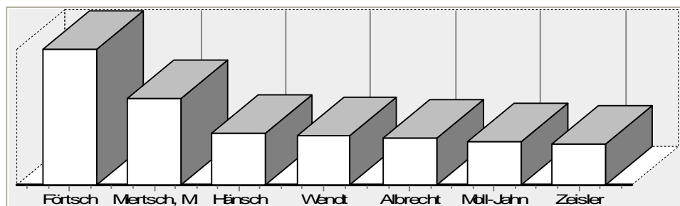
Abbildung 1: Stimmenverteilung