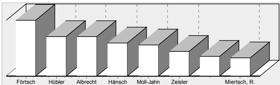
Abbildung 1: Stimmenverteilung