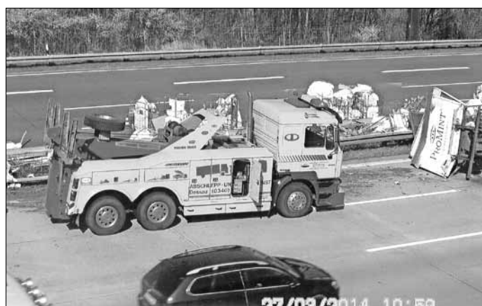
Unfall mit Lkw Abf. 9 A9 bei Vockeroode am 27.03.