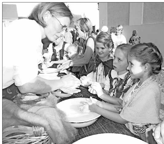
Filzen mit Schafswolle

Ich danke allen fleißigen Helfern, die vor, beim und nach dem Fest aktiv waren und unermüdlich ihre Ideen verwirklicht haben. Namen möchte ich nicht nennen, aus Angst davor, jemanden zu vergessen, denn die Zahl der Helfer war groß. Wie immer konnten wir uns auch auf die Freiwillige Feu-