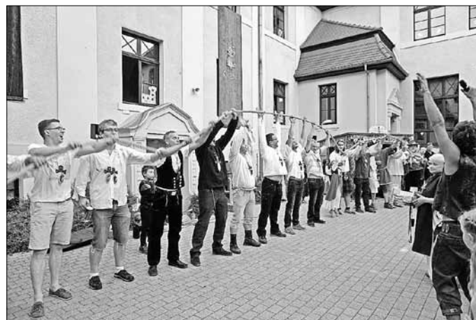
Unsere Tapferen! Auch Vertreter der Feuerwehr gehörten dazu.