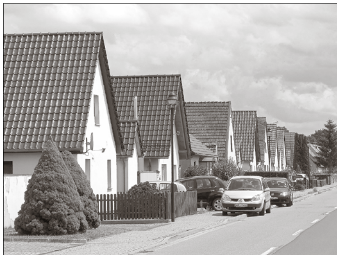
Reihe der giebelständigen ehemaligen Drescherhäuser

In der nächsten Folge stellen wir Ihnen den Ortsteil Schönitz näher vor.