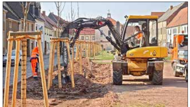
Einfassungen auf dem Markt Stadt Wörlitz

Der Breitbandausbau in unserer Stadt schreitet weiter voran. Aktuell finden in den Ortsteilen Tiefbauarbeiten statt. Darüber hinaus wurden die Straßeneinläufe an der Ecke Försterstraße/Antoinettenstraße im Ortsteil Oranienbaum saniert. Die Fahrradständer im Ortsteil Griesen wurden umgesetzt und sind nun wieder einsatzbereit. Bezüglich der Fördermittelanträge (z. B. Klimamanager, Bundesprogramm (Kita) und Leitbild) liegen noch keine weiteren Informationen vor.