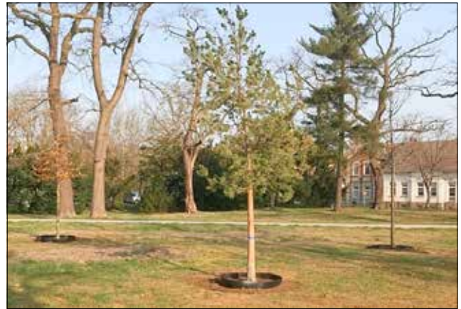
Pflanzungen anlässlich 30 Jahre Tag der Deutschen Einheit, Eröffnung war am 25. April zum Tag des Baumes geplant

Dieser Vorgang ist noch nicht abgeschlossen. Im Rahmen des Planfeststellungsverfahrens werden die Träger öffentlicher Belange, Bürger und juristische Personen angehört. Das erfolgt durch Bekanntgabe in den Gemeinden und mittels Offenlage der Antrags-/Planunterlagen. Hier können Anregungen und Bedenken geltend gemacht werden, die dann in den Abwägungsprozess der Abfallbehörde einfließen. Das Planfeststellungsverfahren ist noch nicht eröffnet.