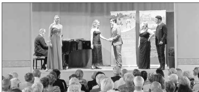
Gesellschaft der Freunde des Dessau-Wörlitzer Gartenreiches e.V.

über die Grenze zwischen Leidenschaft und Wahnsinn. In dieser Gala geht es um Leidenschaft, die Leidenschaft junger Sänger für ihren Beruf, die Leidenschaft des Publikums für die zeitlose Kunstform Oper - und es geht auch um die meist tragische Leidenschaft der Opernfiguren, die in dieser Gala erscheinen. Der Eintrittspreis beträgt 19,00 €, ermäßigt 17,00 €. Karten sind im Vorverkauf erhältlich an den Kassen des Anhaltischen Theaters, bei der Touristinformation Dessau-Roßlau, beim Besucherring des Anhaltischen Theaters und bei der Wörlitz-Information.