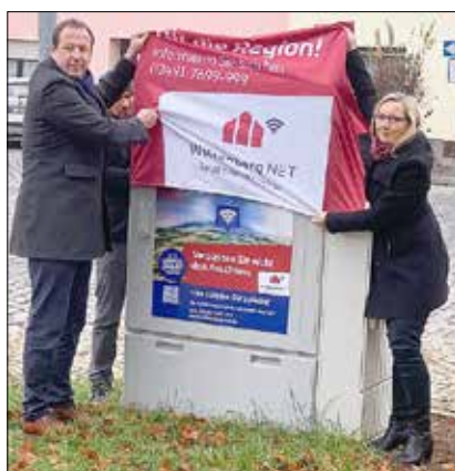
Inbetriebnahme des Breitbandnetzes der wittenberg-net im Stadtgebiet.

Liebe Bürgerinnen und Bürger unserer Stadt Oranienbaum-Wörlitz, seit dem 1. November 2020 können die Einwohner/-innen in den bisher unterversorgten Gebieten in den Ortsteilen Brandhorst, Goltewitz, Gohrau, Griesen, Horstdorf, Kakau, Riesigk, Stadt Wörlitz sowie in Teilen von Oranienbaum schnelles Internet mit Geschwindigkeiten von mindestens 50 Mbit/s und mehr erhalten. Bei dem Betreiber des Breitbandnetzes handelt es sich um wittenberg-net, ein Tochterunternehmen der Stadtwerke Wittenberg. Für die Umsetzung des Vorhabens wurden über 50 km Glasfaserleitungen verlegt sowie zahlreiche Verteilerschränke errichtet und mit entsprechender Technik ausgestattet.