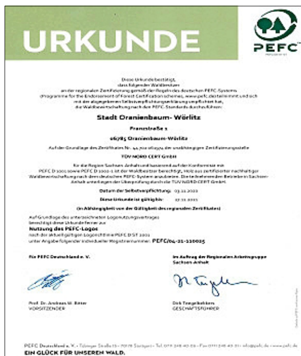
Urkunde der PEFC-Zertifizierung des Stadtwaldes Oranienbaum

Des Weiteren erfolgte anhand einer schriftlichen Stadtratssitzung am 16. Dezember 2020 eine Vergabe der Planungsleistung zur Erstellung eines IGEK's (Integriertes Gemeindliches Entwicklungskonzept) für die Stadt Oranienbaum-Wörlitz. Die Fördermittelanträge zum Bau des geplanten Spielplatzes in Wörlitz wurden im Dezember gestellt. Mit dem Bau soll voraussichtlich im Jahr 2021 begonnen werden. Die Ausschreibungen zum Innenausbau des neuen Rathauses werden vorbereitet, so dass die Maßnahmen im 1. Quartal 2021 fortgeführt werden könnten.