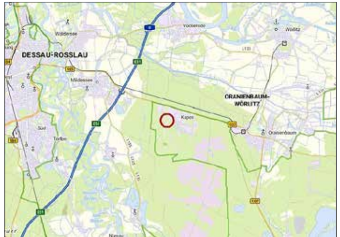
Übersichtsplan

Die Lage des Plangebietes des Bebauungsplanes Nr. 14/2021 „Freiflächenphotovoltaikanlage an der B 107“ ist auf nachfolgenden Abbildungen ersichtlich: