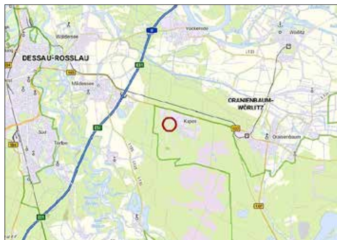
Übersichtsplan

Es wird darauf aufmerksam gemacht, dass Dritte (Privatpersonen) mit der Abgabe einer Stellungnahme der Verarbeitung ihrer angegebenen Daten, wie Name, Adressdaten und E-Mail-Adresse zustimmen. Gemäß Art. 6 Abs. 1c EU-DSGVO werden die Daten im Rahmen des Bebauungsplan-Verfahrens für die gesetzlich bestimmten Dokumentationspflichten und für die Informationspflicht Ihnen gegenüber genutzt. Die Teilfläche für die beabsichtigte Änderung ist auf der nachfolgenden Übersicht erkennbar: