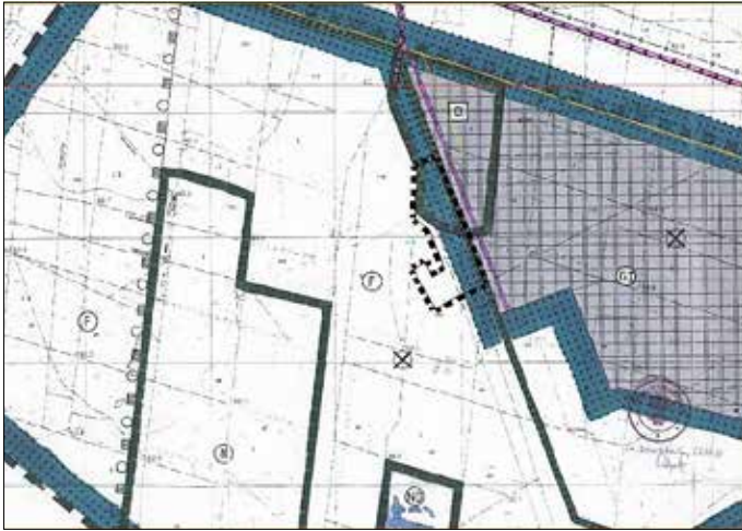
Geltungsbereich der Änderung des Flächennutzungsplanes, ohne Maßstab

Nachfolgende Unterlagen sind Bestandteil der öffentlichen Auslegung: