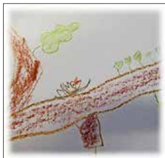
Gemälde des Kuckucks aus dem Lied von L. und F., beide 5 Jahre alt)

Da der Winter mit seinen eisigen Temperaturen sich - genau wie in den vergangenen Jahren - nicht so schnell verabschiedet, nutzten wir den Schnee, der uns beschert wurde. Unsere Praktikantin hatte ein Schnee-Experiment parat, bei dem ein echter Schneesturm im Glas erzeugt wurde! Natürlich ging es direkt danach hinaus in den Spielgarten, um Schneekristalle unter die Lupe zu nehmen. Das waren spontane Angebote, die sich aufgrund der Wetterlage einfach ergaben. So konnten wir situativ den aktuellen Fragen der Kinder auf die Spur gehen, ... denn am nächsten Tag war der ganze Schneezauber wieder verschwunden.