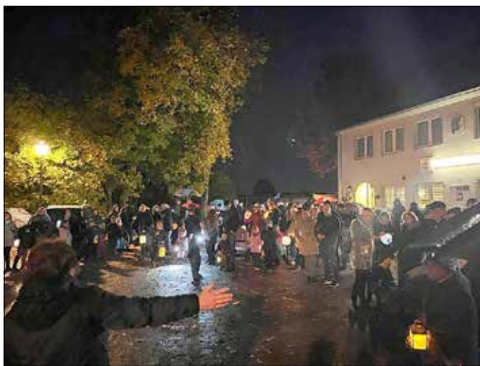
Herzlichst, das Team der integrativen Kita „Villa Sonnenschein“ in Wörlitz

Wir wünschen unseren Kindern eine wunderschöne aufregende Weihnachtszeit mit vielen Überraschungen, die die Kinderaugen zum Leuchten bringen, sowie allen Familien erholsame Feiertage.