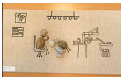
„Beim Zahnarzt“ Steinbild auf Leinwand