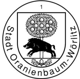
Siegelabdruck des großen Dienstsiegels