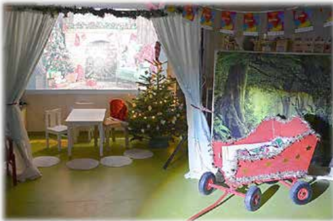
Unser Bühnenbild, die Wichtelwerkstatt, mit Rentierschlitzen