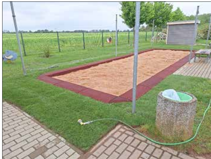
Unsere Jüngsten staunten nicht schlecht und nahmen ihr neu gestaltetes Sandspiel-Paradies umgehend ein:

Gemeinsam mit unserer Grundschule gibt es regelmäßige Treffen zur Prozessbegleitung. Das erste Treffen fand virtuell im Februar statt. Unser erstes Coaching war am 26.04.24. Die Zusammenarbeit spielt für uns schon immer eine große Rolle, da wir u.a. die Familien entlasten möchten und eine begleitete Hausaufgabenzeit anbieten. Es geht um grundlegende Voraussetzungen beider Häuser und die Verbesserung des pädagogischen Austauschs. Wir freuen uns auf das nächste Coaching am 26.06. und erlangen in den Arbeitsintervallen eine neue Bewusstheit für moderne und kindorientierte Zusammenarbeit beider Institutionen. Am 01.11.24 wird ein Brückentag genutzt, um eine gemeinsame große Reflexion durchzuführen. Alle Lehrer und die Horterzieher sowie die Leitung werden dann in den von unserem Coach moderierten Austausch gehen. Wir sind gespannt und lernbereit und hoffen, dass effektive Ergebnisse dieses Projektes den wichtigsten Personen zugutekommen werden, unseren Kindern.