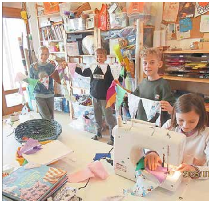
... mit besten Grüßen ... alle Kinder und das Team der integrativen Kita Wörlitz

Unser Hort nimmt gemeinsam mit der Schule am ministerialen Projekt „Kooperation Schule-Hort“ teil (wie bereits berichtet) und hat sich damit zur Aufgabe gemacht, die Zusammenarbeit zwischen beiden Institutionen zu erweitern. So fanden z. B. erstmals die Entwicklungsgespräche gemeinsam statt, mit Lehrer/in und Horterzieher/in. Dieses Experiment erwies sich als sehr sinnvoll und positiv, hat zudem den Vorteil, dass die Eltern nicht zweimal zum Gespräch müssen. Des Weiteren gibt es noch engere Zusammenarbeit und regelmäßige Treffen. Im Verlauf dieses Projektes werden neue Lernmittel angeschafft, so z. B. Smartboards und Tablets für Hort und Schule. Beide Seiten profitieren von diesem Projekt, sind zur gemeinsamen Reflexion des pädagogischen Alltags angehalten. Es beginnen nun langsam die Vorbereitungen für unsere große Jubiläumswoche, im Kreativraum ist immer was los! Im Moment nähern die Kinder mit der Nähmaschine kleine Dekoartikel und eine ganz laaaaaaaange Wimpelkette zum Schmücken unseres Außengeländes: