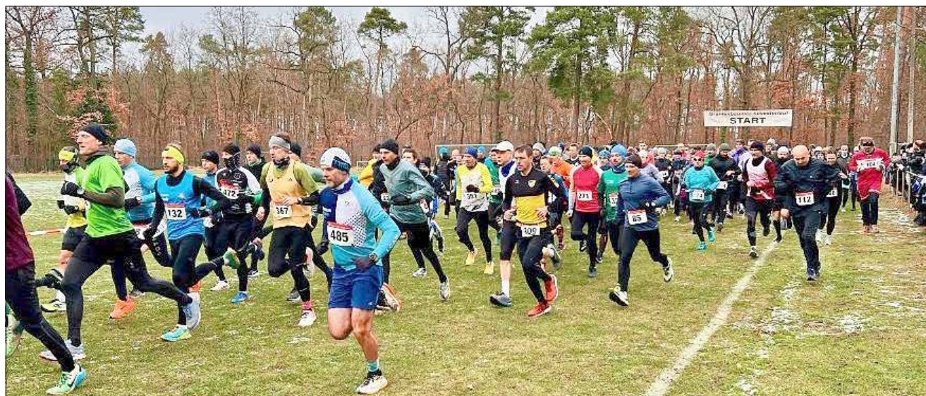
Der Start zum 43. Silvesterlauf.