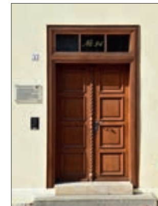
Kreuzstockfenster und kassettierte Flügeltür des frühen 19. Jahrhunderts