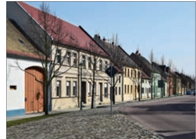
Ansicht der historischen Bebauung in der Erdmannsdorffstraße