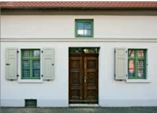
Klassizistische Fassadengestaltung mit schmalem Gesimsband und umlaufenden Fensterfaschen