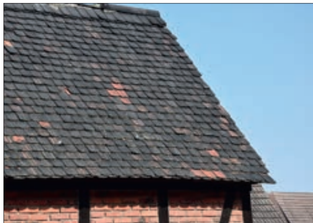
Dachdeckung mit Biberschwanzziegeln