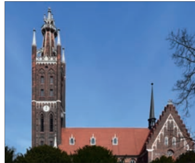
Weithin sichtbarer Turm der neugotischen Kirche

Unmittelbar an den Ortskern grenzen das Schloss und die Wörlitzer Anlagen, einer der ältesten englischen Landschaftsgärten auf dem europäischen Kontinent. Das Schloss war stilbildendes Vorbild für den Klassizismus in Deutschland und wurde von Friedrich Wilhelm von Erdmannsdorff entworfen. Dieser gestaltete ebenfalls den Großteil der fürstlichen Leitbauten in der Stadt, die im gesamten Stadtbereich verteilt errichtet wurden. Am eindrucksvollsten und weit über Wörlitz hinaus wahrnehmbar ist die 1812 errichtete Kirche im neugotischen Baustil. Die Ortseingangssituationen akzen-