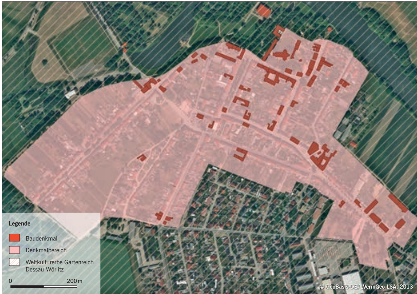
Denkmalbereich des Ortskerns Wörlitz

Wörlitz ist seit dem Jahr 2000 Bestandteil des UNESCO-Welterbes Gartenreich Dessau-Wörlitz . Der Ortskern ist Denkmalbereich.