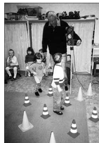
Archivfoto Kinder lernen die Ampel kennen

Dabei erleiden sie oft schwere Verletzungen oder werden getötet. Wenn ein Unfall passiert, dann liegt es nicht an ihnen. Allein ihre Eltern tragen die Verantwortung. Wer seine Kinder im Auto nicht sichert, handelt unverantwortlich. Die Sitze mit der Polsterung und die Rückenlehnen der Vordersitze bieten bei einem Unfall keinen Schutz! Deshalb führen unsere Mitarbeiter schon in den Kindereinrichtungen für unsere jüngsten Verkehrsteilnehmer einen altersgerechten Verkehrsunterricht durch. Das folgende Archivfoto zeigt die Jüngsten beim Kennlernen der Verkehrsampel