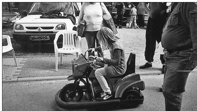
Archivfoto: Mini-Cars bei unseren Jüngsten beliebt.

Die Gebietsverkehrswacht wird anlässlich des Wanderwegfestes in Vockerode, welches zugleich mit dem 100-jährigen Jubiläum der Freiwilligen Feuerwehr begangen wird, ein umfangreiches Programm gestalten. Diesmal werden nicht nur unsere E-Cars zum Einsatz kommen, sondern auch umfangreiche Technik der Landesverkehrswacht Sachsen-Anhalt.