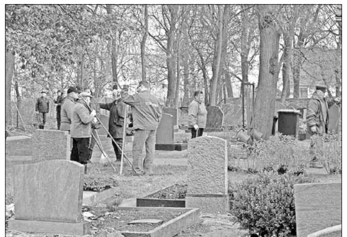
Einsatz 2013