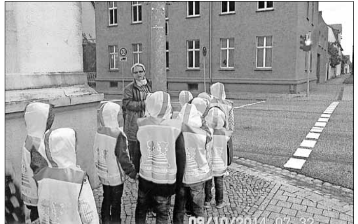
Schüler der 1. Klasse der Grundschule Oranienbaum warten geduldig auf das „Grünsignal“ an der Hauptkreuzung

Hier galt es beim „Grünsignal“ die Fahrbahn drei Mal sicher zu überqueren um dann auf dem sicheren Gehweg das Schulgebäude wieder zu erreichen.